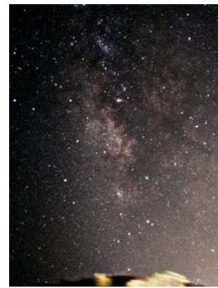
Nuetshimmel mat Mëllechstrooss bei wéineg Liichtverschmutzung