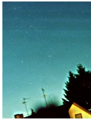
Nuetshimmel bei staarker Liichtverschmutzung

Iwwrigens: Dës Noutwendikeet gouf schon a verschiddene Länner erkannt. Slowenien, Tcheschien, Deeler vun Italien, Spuenien an den USA.... hunn Gesetzer géint d' Liichtverschmutzung agesat.